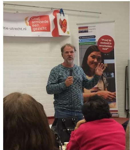
Afbeelding 2: (Ypma)

Donderdag 13 oktober heb ik deelgenomen aan de integratielunch met dialoog in de gemeente Utrecht. Naast de Turkse en Marokkaanse gemeenschap was ook de (Hindoestaanse) Surinaamse gemeenschap vertegenwoordigd. Na de gezellige lunch ging de groep van circa 100 personen uiteen in groepen van 7-10 personen. Samen met een gespreksleider van 'Utrecht in dialoog' ben ik aangeschoven bij een dialoog over armoede bij Hindoestaanse Surinamers. Na afloop van deze dialoog was er een terugkoppeling naar partijvoorzitter van de PvdA Hans Spekman. De resultaten van alle dialogen worden later terug gekoppeld naar het Utrechtse college.